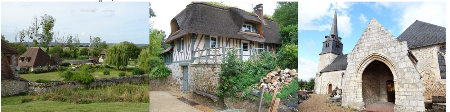
Les abords du monument

Les avis seront cohérents avec ceux émis ces dernières années, à savoir : pas de maisons à volume compliqué (type V, W, Y, ou Z), pentes à 45° pour les volumes principaux, ardoise ou tuile plate de teinte brun vieilli, à 20u/m 2 , avec un débord de toiture de 20cm, enduit de teinte beige clair avec modénatures (au choix: chaînages, encadrement de fenêtres, soubassement, colombage...). *Voir les autres fiches.